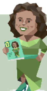
Oprah, 42 Die Protagonistin

Mehrfach Beteiligter in der Transformation