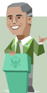
Barack, 48 Der Protagonist

Transformations-Leaderin mit Rollen in Konzeption und Umsetzung